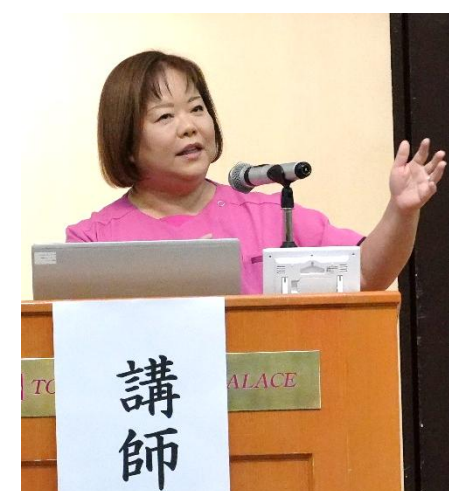
野村氏講演の様子

野村氏は、離職の背景には「今が嫌になった」という感情があることが多いと述べ、どのような人が、どのような場面で「今」を嫌になるのか、典型的なパターンと対処法を解説した。その際に、「野村流」の考えとして、看護のあるべき姿を「魅せること」、食べる・寝る・動くといった生活リズムを管理することの重要性を強調した。