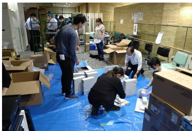
入れ替え作業の様子