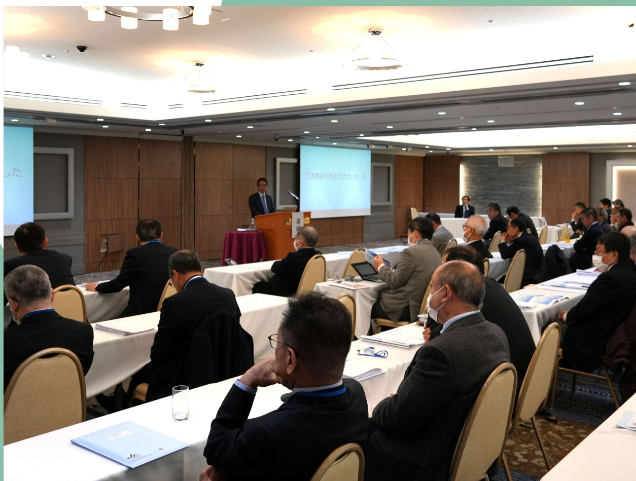
厚生連病院長セミナーを開催