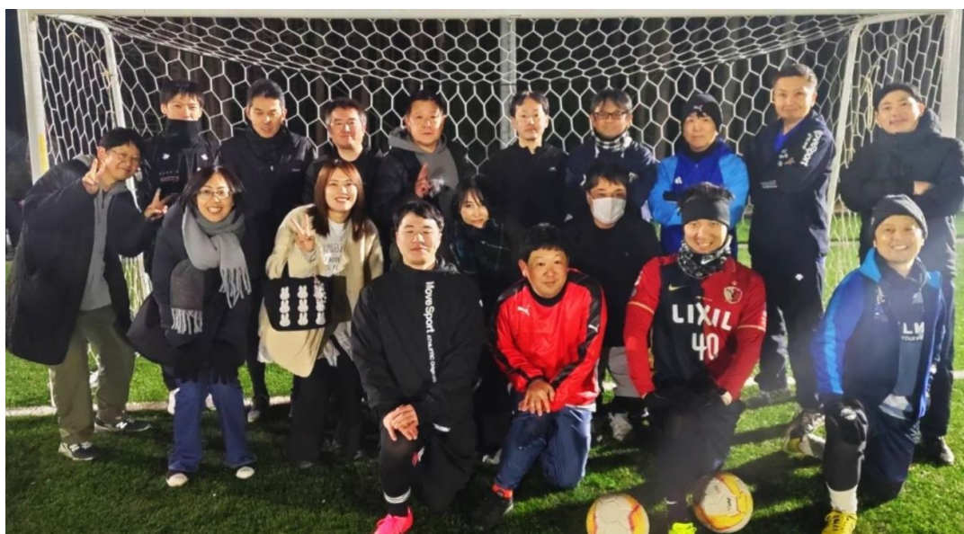
参加した選手たち

今後も J A グループ茨城の一員として、地域と一体となった取り組みを継続し、皆さまに愛される組織作りを目指して参ります。