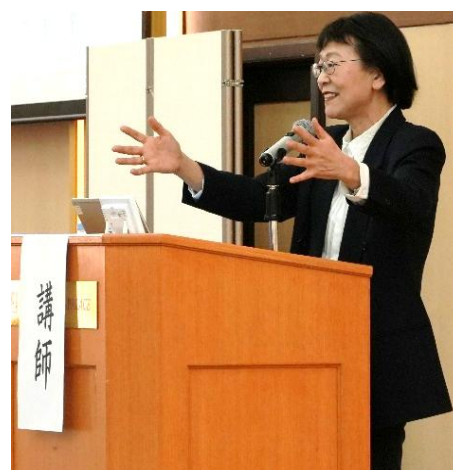
中林氏講演の様子

参加者からは、「わかりやすく、具体的に方向性を知ることができた」「不安定な要素は多いものの、ポイントになりそうな点を理解でき、今のうちから情報収集や準備