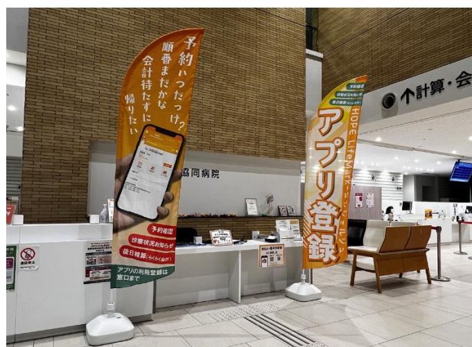
アプリ利用登録窓口